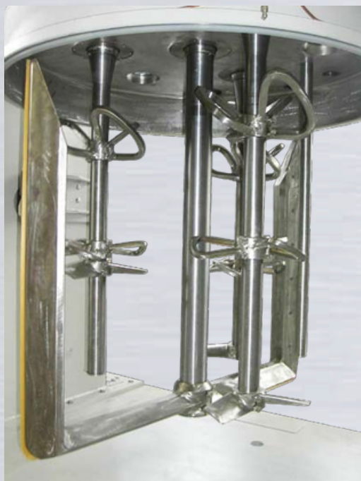
Particolare degli alberi di miselazione